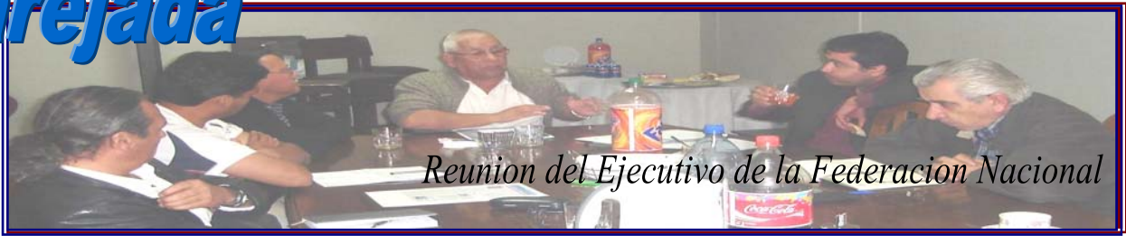
Reunión del Ejecutivo de la Federación Nacional